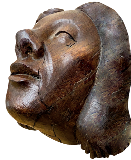
Voici le profil de la fille du Conteur

Le motif qui crée le mouvement dans les cheveux de la jeune fille t'aidera dans les énigmes suivantes.