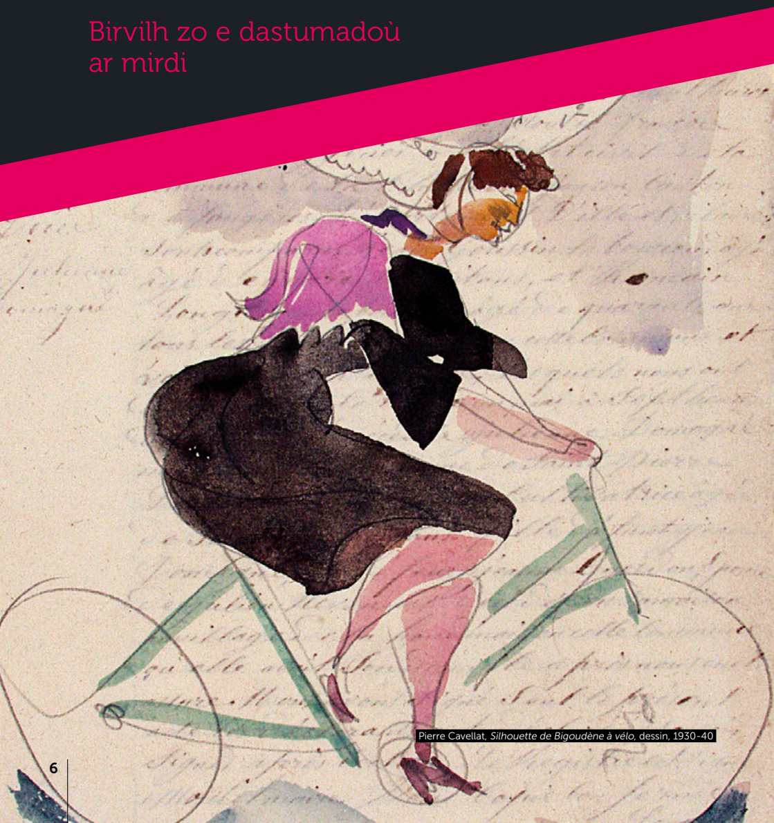
Pierre Cavellat, Silhouette de Bigoudène à vélo , dessin, 1930-40